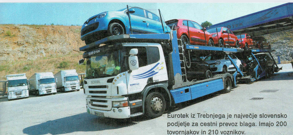
Eurotek iz Trebnjega je največje slovensko podjetje za cestni prevoz blaga. Imajo 200 tovornjakov in 210 voznikov.

Manager ga je lani uvrstila na lestvico najbogatejših Slovencev: njegovo premoženje so ocenili na 13,8 milijona evrov, kot edini samostojni podjetnik na lestvici je bil uvrščen na 91. mesto. Javnosti je postal bolj znan pred leti, ko je urad za preprečevanje pranja denarja poročal o njegovih transakcijah v davčno oazo, in sicer v Limassol na Ciper.