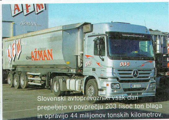
Slovenski avtoprevozniki vsak dan prepeljejo v povprečju 203 tisoč ton blaga in opravijo 44 milijonov tonskih kilometrov.