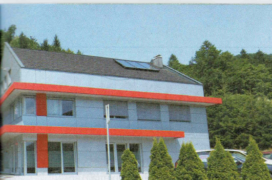
Družba Sečnik Transport je ena večjih avtoprevoznih družb na Škofjeloškem. Lastnik Ivan Sečnik živi Na Logu pri Škofji Loki.